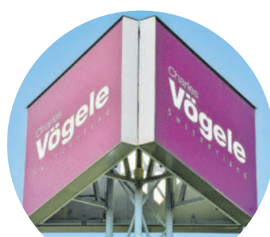
Charles Vögele ist fast Vergangenheit, doch Mitarbeiter hoffen, dass es weitergeht.

Während die Vögele/OVS-Filialen in Deutschland und der Schweiz bereits geschlossen sind, besteht in Vorarlberg und Österreich durchaus Zuversicht, dass es unter neuem Eigentümer weitergeht. Zur Entschärfung der finanziellen Situation der Mitarbeiter hat der Insolvenzverwalter die Augustgehälter aus der Insolvenzmasse bevorschusst. Die ausständigen Juligehälter und das Urlaubsgeld werden vom Insolvenzentgeltfonds an die Mitarbeiter ausbezahlt, die Auszahlung wird aber noch einige Zeit dauern. VN-SCA