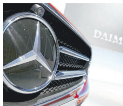
Der Stern strahlte im Juli etwas verhaltener als die Monate zuvor.

STUTTGART Trotz eines vergleichsweise schwachen Julis ist der Autobauer Mercedes-Benz weiter auf Kurs für einen neuen Absatzrekord. Im Juli sind um 8 Prozent weniger Autos verkauft worden als im Juli 2017. Insgesamt konnte der Autobauer mit dem Stern seit Jahresbeginn 1,35 Millionen Autos verkaufen, um 2,3 Prozent mehr als im Vorjahr.