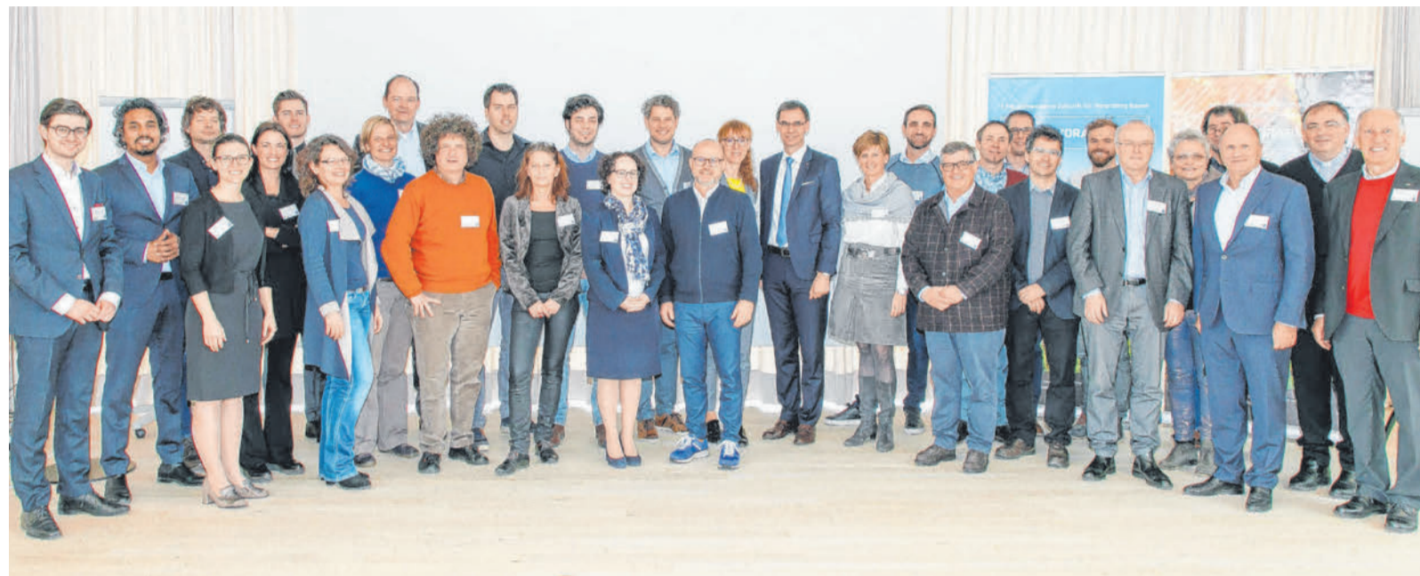
Die 30 Workshop-Teilnehmer standen vor der Aufgabe, die Stärken und positiven Eigenschaften Vorarlbergs zu einer Marke weiterzuentwickeln. VLK/HB