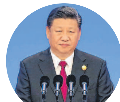
Chinas Präsident Xi Jinping bei der Messe International Import Expo.

SCHANGHAI Chinas Präsident Xi Jinping hat Erleichterungen für Importe in Aussicht gestellt. „Es ist unsere aufrichtige Zusage, den chinesischen Markt zu öffnen.“ Die Risiken für manche Branchen in China nähmen zu, doch Maßnahmen zur Förderung des Wachstums trügen Früchte. Wegen der Größe könne man Schocks widerstehen.