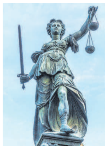
Das Privatinsolvenzrecht verschaffte Justitia seit einem Jahr mehr Arbeit.

Für die nächsten Monate rechnen die Gläubigerschützer mit einer Abflachung des Anstiegs. „Der neue Privatkonkurs hat einen noch nie