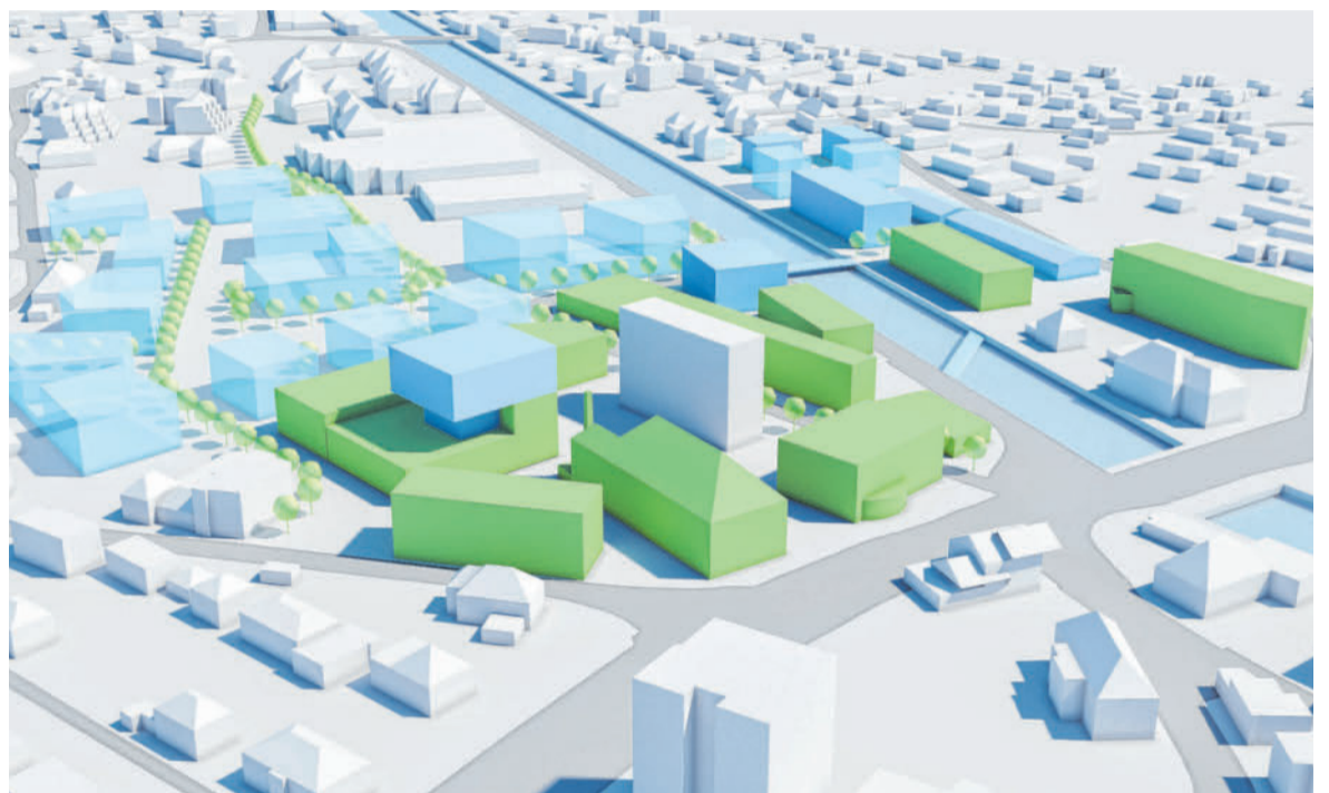
In den kommenden 16 Jahren wird der Campus V kräftig erweitert.

Denn bei der Veranstaltung wurden der Campus V und sein geplanter Ausbau bis 2035 als Leuchtturm der Marke Vorarlberg präsentiert. Das