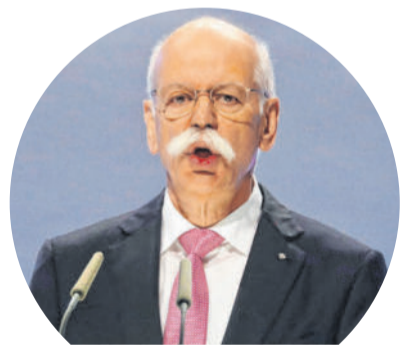
Dieter Zetsche nimmt als Vorstandschef bei Daimler Abschied.

STUTTGART Die Ära endet mit einem Lächeln und einer kleinen Verbeugung. Nach mehr als 13 Jahren an der Spitze hat sich Dieter Zetsche als Vorstandschef bei Daimler verabschiedet. Unter Führung des 49 Jahre alten Schweden Ola Källenius geht der Stuttgarter Autobauer nun in das „Projekt Zukunft“, einen umfassenden Konzernumbau.